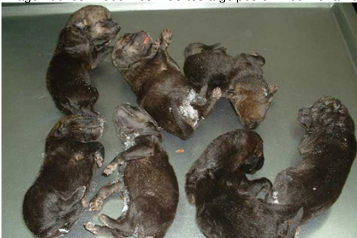
Imagen de los 7 lobeznos muertos a golpes en Redimuña 2004:

En 2004, UN FUNCIONARIO DEL PARQUE NACIONAL Y UN GUARDIA CIVIL MATARON A GOLPES CONTRA LAS ROCAS Y POR ESTRANGULAMIENTO A UNA CAMADA ENTERA DE SIETE LOBEZNOS en Redimuña, Lagos (ver foto).