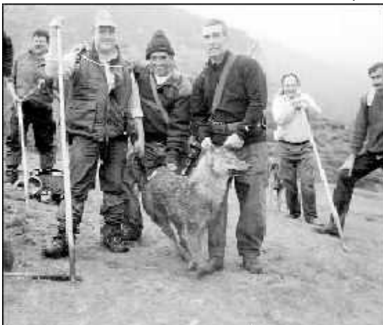
Abajo: Foto de la última loba del Cuera en 2008, tras ser perseguida implacablemente en una batida multitudinaria de exterminación compuesta por cazadores locales y ganaderos.