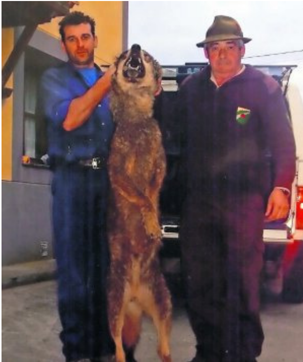
Arriba: El 13 febrero 2007 mataron este lobo en la Sierra del Cuera por guardas y personal de Tragsa.

(art.9.3) porque lo hace sin criterio científico y de forma arbitraria. Pero que el Principado decidiera eso, no significa que por ello sea posible hacerlo en el PN.